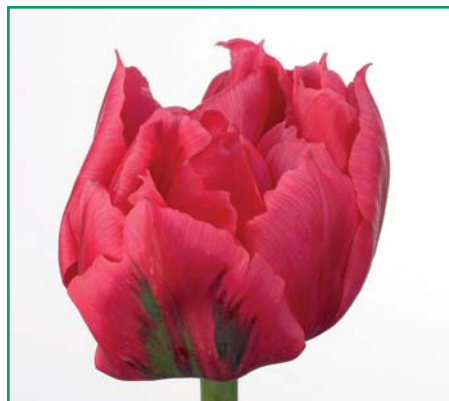
Tulipa ' Crown Princess Mary '

Tulipa ' Cream Perfection Design ' (Triumf Groep) Edibulbcode: 81403 Mutant van: 'Cream Perfection' Registrant: Holland BolRoy Markt B.V., Heiloo. Samenvatting: lichtgeel 4D met gele 6C strepen. Blad groen met geelgroene strepen. Winner: Mts Mellema-Versteeg, Creil.