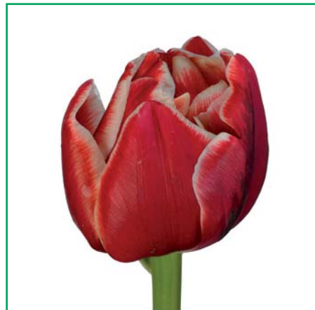
Tulipa 'President Vaira'