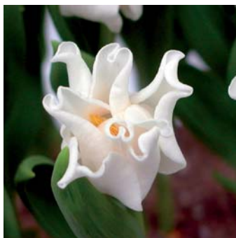
Tulipa 'White Liberstar'

De KAVB en/of BloembollenVisie zijn niet aansprakelijk voor schade voortvloeiend uit de registratie en/of publicatie van de desbetreffende cultivars.