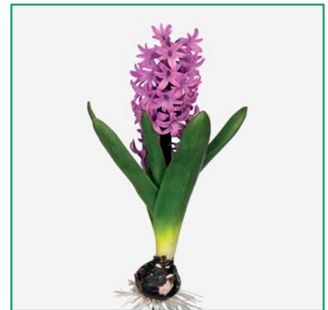
Hyacinthus orientalis 'Purple Pride'

Edibulbcode: 81315 Registrant: V.o.f. Orientalis, Anna Paulowna. Samenvatting: donkerviolet 86A. Winner: V.o.f. Orientalis, Anna Paulowna.