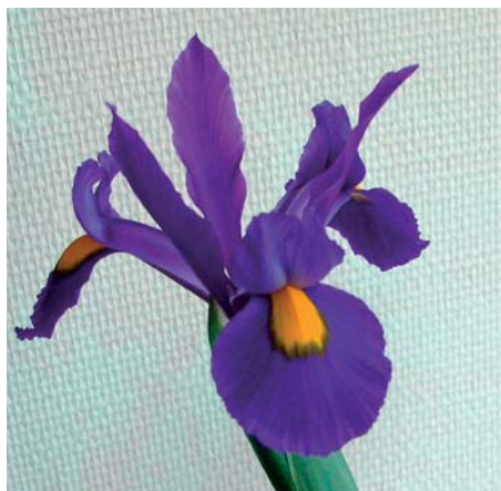
Iris ' Explorer '

Hyacinthus orientalis ' Yellow Creation ' Edibulbcode: 80231 Registrant: Kapiteyn Speciale Culturen, Anna Paulowna. Samenvatting: lichtgeel 5D met geel 5C. Winner: V.o.f. Orientalis, Anna Paulowna.