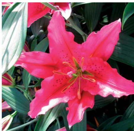
Lilium ' Knightsbridge '

Lilium ' Keynote ' (Aziatische Groep) Edibulbcode: 78767 Registrant: The Originals B.V., St. Maartensvlotbrug. Samenvatting: wit NN155D, op snee donker paarsrood 59A. Spikkels donker paarsrood 59A. Papillae afwezig. Winner: Bischoff Tulleken Lelies B.V., Wieringerwerf.