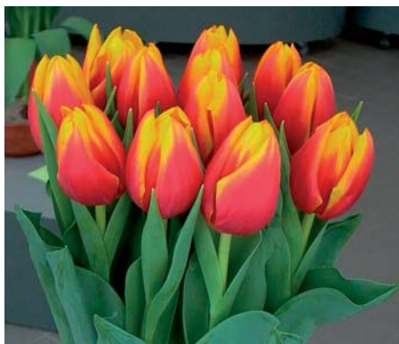
Tulipa 'Hennie vander Most'