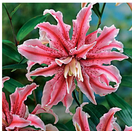
Lilium ' Magic Star '

Lilium ' Macallan ' (LA-hybrid Groep) Edibulbcode: 80260 Registrant: Vletter en den Haan Beheer B.V., Rijnsburg. Samenvatting: wit NN155B. Spikkels donker paarsrood 59A. Papillae afwezig. Winner: Vletter en den Haan Beheer B.V., Rijnsburg.