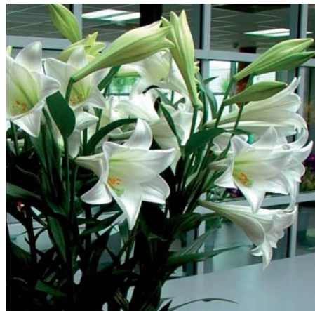
Lilium 'Bright Tower'

Edibulbcode: 77695 Registrant: Vletter en den Haan Beheer B.V., Rijnsburg. Samenvatting: blauwrose 72C. Spikkels paars 61A. Papillae wit 155D en paars 61B. Winner: Vletter en den Haan Beheer B.V., Rijnsburg.