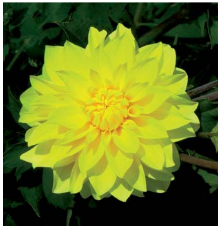
Dahlia ' American Sun '