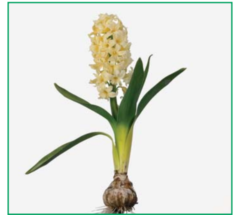
Hyacinthus orientalis 'Gold Digger'

Edibulbcode: 81312 Registrant: Gebr. Hogervorst, Noordwijkerhout. Samenvatting: lichtgeel 4D met wit 155D. Winner: V.o.f. Orientalis, Anna Paulowna.