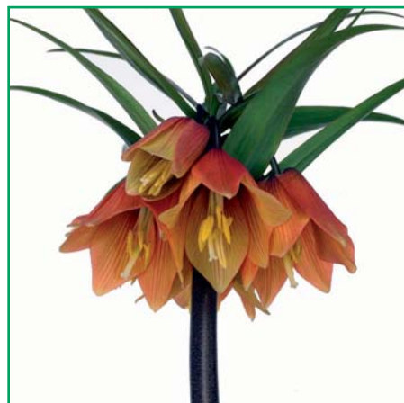
Fritillaria imperialis 'Early Fantasy'