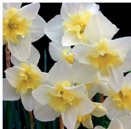
Narcissus 'Bella Estrella'

Narcissus 'Art Design' (Dubbele Groep), 4 Y-Y Edibulbcode: 81487 Registrant: Fa. M.H. van der Zon & Zn., Lisse. Samenvatting: lichtgeel 4D met geel 12A. Winner: J. de Winter, Voorhout.