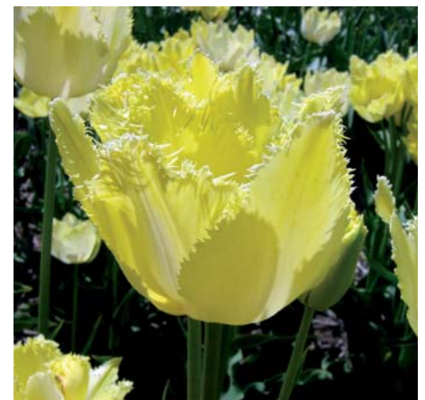
Tulipa 'Rundale Palace'

Tulipa 'Rosy Diamond Pipi' (Dubbele Late Groep) Edibulbcode: 81460 Mutant van: 'Blue Diamond' Registrant: Holland BolRoy Markt B.V., Heiloo. Samenvatting: paars 64A met paarse 64B rand. Winner: A.P. ter Steege, Callantsoog.