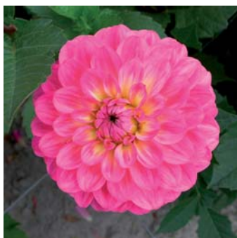
Dahlia 'El Santo'