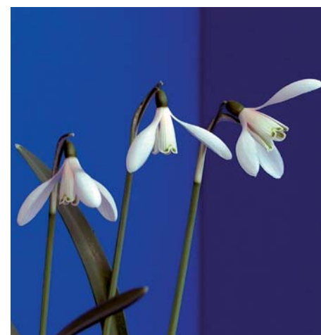
Galanthus nivalis 'March Sunshine'