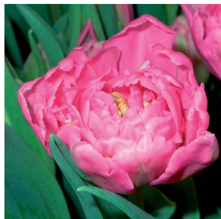
Tulipa ' Dior '