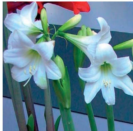
Hippeastrum 'White Rascal'

Edibulbcode: 81307 Registrant: Kwekerij de Oudendam B.V., Woerdense Verlaat. Samenvatting: donker paarsrood 60A met licht geelbruin 158D. Winner: Kwekerij de Oudendam B.V., Woerdense Verlaat.