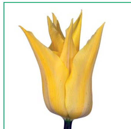
Tulipa ' Florijn Chic '

Tulipa ' Final Move ' (Dubbele Late Groep) Edibulbcode: 81412 Mutant van: 'Final Star' Registrant: Fa. P. Boon & Zn., Venhuizen. Samenvatting: bruinpaars 186B, oranjebruin 31B gerand. Winner: Fa. P. Boon & Zn., Venhuizen.