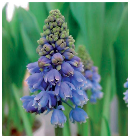
Muscari armeniacum 'Artist'

Lilium 'Yellow Twinkle' (Aziatische Groep) Edibulbcode: 69461 Registrant: Lily Company B.V., Andijk. Samenvatting: geeloranje 14A. Spikkels paars 61A, veel. Papillae afwezig. Winner: Laan Lelie, Zwaagdijk.