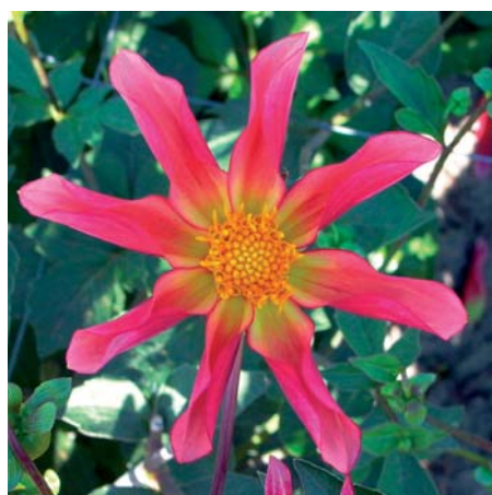
Dahlia 'Honka Surprise'