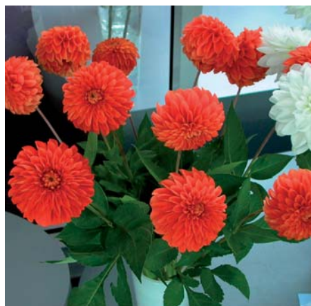
Dahlia 'Happy Halloween'

Dahlia 'Guitar Man' (Decoratieve Groep) Edibulbcode: 81276 Registrant: J. van der Linden & Zonen B.V., Hillegom. Samenvatting: wit 155D met rood 46B. Winner: N. Kops, Hillegom. Getuigschrift Proeftuin 2009