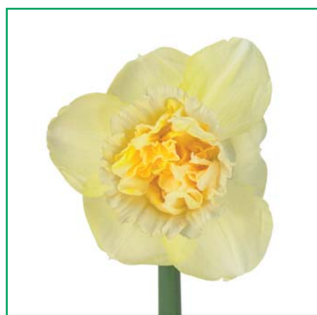
Narcissus 'Art Design'