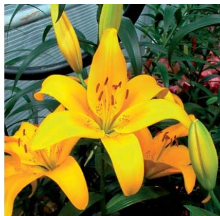
Lilium ' Bananas '

Lilium ' Arbatax ' (LA-hybrid Groep), LEL 2699 Edibulbcode: 78896 Registrant: Vletter en den Haan Beheer B.V., Rijnsburg. Samenvatting: bruinpaars 186B met witte 155D vlek. Spikkels paars 61A. Papillae wit 155D. Winner: Vletter en den Haan Beheer B.V., Rijnsburg.