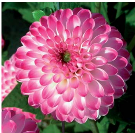
Dahlia ' Pink Isa '