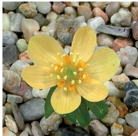
Eranthis hyemalis 'Schwefelglanz'