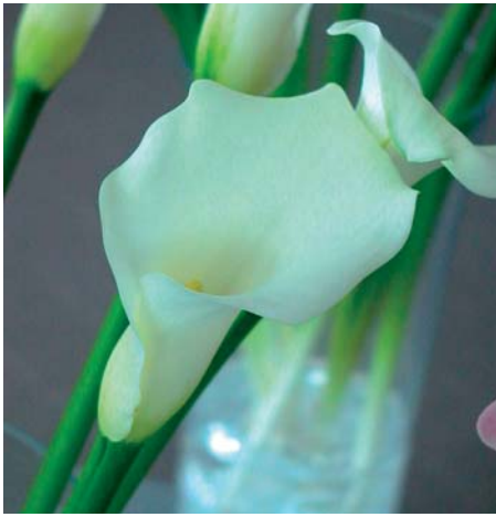
Zantedeschia 'Captain Mirage'

Zantedeschia 'Captain Mirage' , ARA 488 Edibulbcode: 78929 Registrant: Kapiteyn Breeding B.V., Anna Paulowna. Samenvatting: wit 157D. Winner: Kapiteyn Breeding B.V., Anna Paulowna.