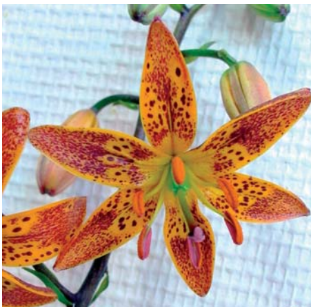
Lilium 'Sunny Morning'

Lilium 'Sun City' (LA-hybrid Groep) Edibulbcode: 81369 Registrant: De Jong Lelies Holland B.V., Andijk. Samenvatting: geeloranje 23A, oranje 24A gerand. Spikkels bruinpaars 183A. Papillae afwezig. Winner: De Jong Beheer B.V., Andijk.