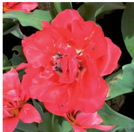
Tulipa 'Verona Fire'

Tulipa 'Vernier' (Dubbele Late Groep) Edibulbcode: 80619 Mutant van: 'Chato' Registrant: VOF J.N. Schouten, Venhuizen. Samenvatting: donker roosrood 52A, geel 6A gerand. Winner: J.N. Schouten, Venhuizen.