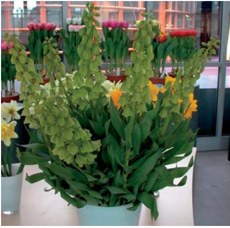
Fritillaria persica 'Ivory Bells'