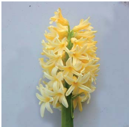
Hyacinthus orientalis 'Yellow Jada'

Winner: V.o.f. Orientalis, Anna Paulowna.