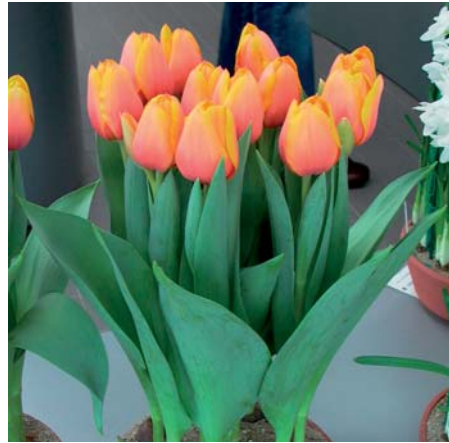
Tulipa 'Diamond Ad Rem'

Tulipa 'Destination' (Triumf Groep) Edibulbcode: 80216 Registrant: Th. vd Gulik, Avenhorn & Fa. W.B. Reus, De Goorn. Samenvatting: paars 71A, blauwrose 72C gerand. Winner: Ropta.