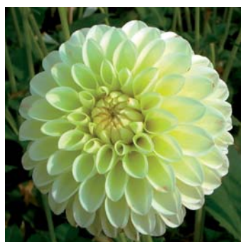
Dahlia 'Boom Boom Yellow'

De KAVB en/of BloembollenVisie zijn niet aansprakelijk voor schade voortvloeiend uit de registratie en/of publicatie van de desbetreffende cultivars.