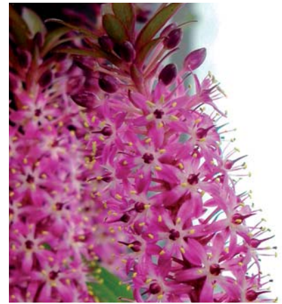
Eucomis ' Joy's Purple '