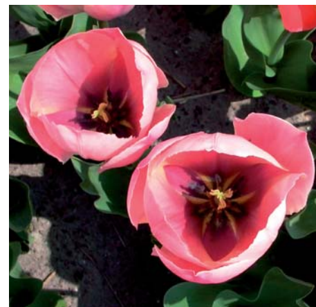
Tulipa 'Salmon Van Eijk'

Tulipa 'Salmon Dynasty' edibulbcode: 74678 heeft als handelsnaam Golden Dynasty.