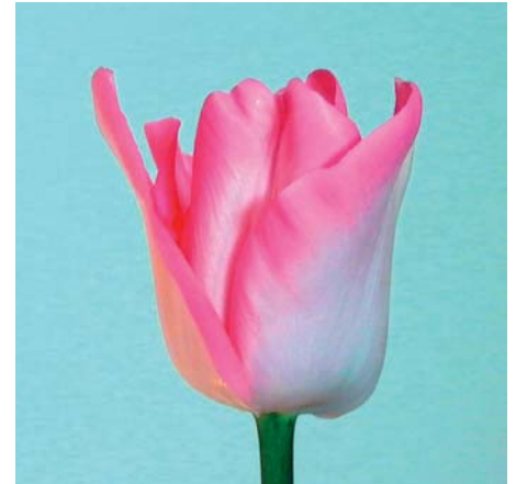
Tulipa ' Arvella '

Tulipa ' Apricot Angelique ' (Dubbele Late Groep) Edibulbcode: 80350 Mutant van: 'Angélique' Registrant: Maveridge International B.V., Sint Maarten. Samenvatting: licht geelbruin 160B met wit N155C. Winner: Maveridge International B.V., Sint Maarten.