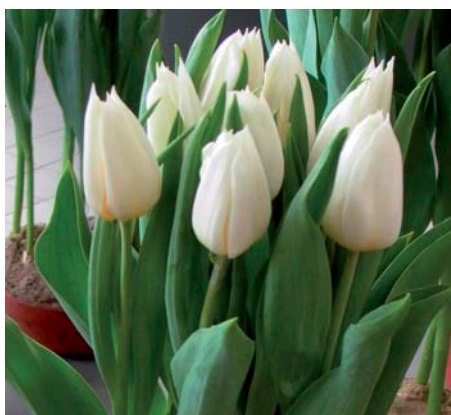
Tulipa 'Delta White'