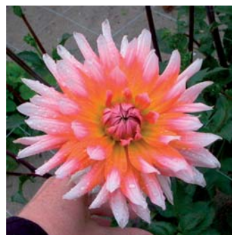
Dahlia 'Okapi Sunset'