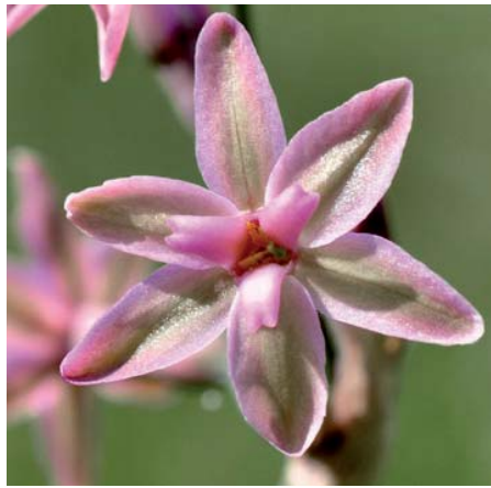
Tulbaghia ' Orla '