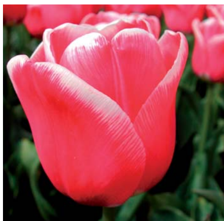
Tulipa 'French Touch'

Tulipa 'French Passion' (Triumf Groep) Edibulbcode: 80576 Registrant: Ernest Turc Productions SAS, Frankrijk. Samenvatting: donker paarsrood 60A, donker roseroed 53C gerand. Winner: INRA, Frankrijk.