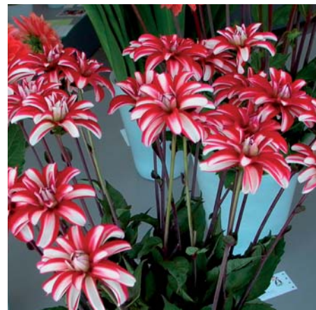
Dahlia ' Mariska Hisko '

Dahlia ' Maaike ' (Decoratieve Groep) Edibulbcode: 80443 Registrant: Hisko Flower, Hoofddorp. Samenvatting: rood 33A, geelgroen 2D gerand. Winner: Hisko Flower, Hoofddorp. Getuigschrift Proeftuin 2008