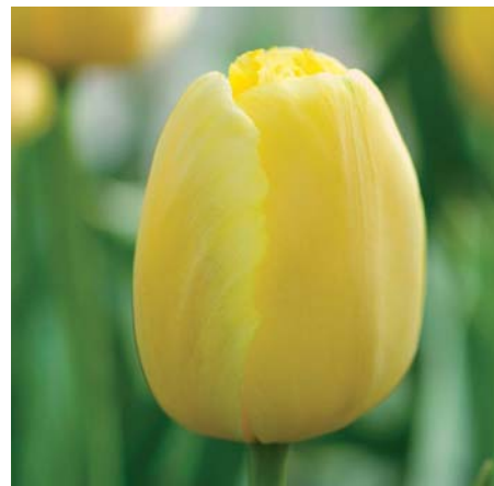
Tulipa 'King Bhumibol'

Tulipa 'Kentucky Star' (Triumf Groep) Edibulbcode: 80585 Registrant: Bulbes Difference B.V., Sint Maarten. Samenvatting: donker paarsrood 53B, donker paarsrood 53A gerand. Winner: INRA, Frankrijk.