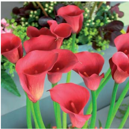
Zantedeschia ' Red Pulse '

Zantedeschia ' Red Alert ', ARA 451 Edibulbcode: 77468 Registrant: Sande B.V., 't Zand. Samenvatting: rood 42B. Winner: Sande B.V., 't Zand.