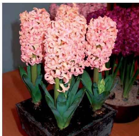
Hyacinthus orientalis 'Bellevue'

Hyacinthus orientalis 'Aladdin' Edibulbcode: 80505 Registrant: V.o.f. Orientalis, Anna Paulowna. Samenvatting: licht blauwviolet 76A, over middennerf donkerviolet 79B. Winner: V.o.f. Orientalis, Anna Paulowna.