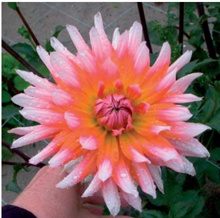
Dahlia ' Okapi's Sunset '