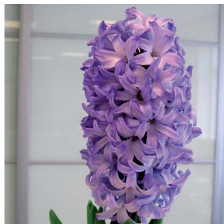
Hyacinthus orientalis 'Chicago'

Hyacinthus orientalis 'Boston' Edibulbcode: 80507 Registrant: V.o.f. Orientalis, Anna Paulowna. Samenvatting: paars 70B, licht blauwviolet 84C gerand. Winner: V.o.f. Orientalis, Anna Paulowna.