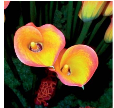
Zantedeschia ' Tresor '

Samenvatting: licht geelbruin 158B met roodrose 51C. Winner: Neoflora (EDMS.) BPK., Zuid-Afrika.