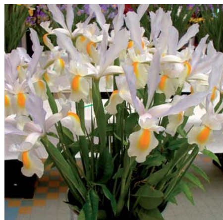
Iris 'Nofa Cream'

Iris 'Muirfield' (Hollandse Iris Groep) Edibulbcode: 80525 Registrant: John Nijssen Bloembollen, Velsbroek. Samenvatting: groenbruin 153A met violetblauw N89A en blauwviolet 86C. Winner: John Nijssen Bloembollen, Velsbroek.