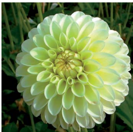
Dahlia ' Boom Boom Yellow '

Dahlia ' Boom Boom Yellow ' (Bal Groep) Edibulbcode: 74302 Registrant: J. van der Linden & Zonen B.V., Hillegom. Samenvatting: geelgroen 150D, aan basis geelgroen 1C