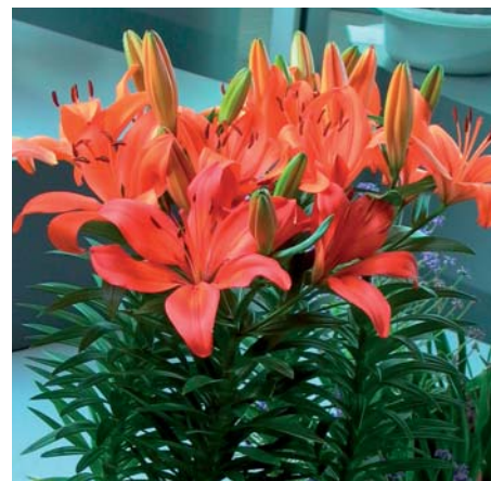
Lilium ' Orange Matrix '

Lilium ' Orange Matrix ' (Aziatische Groep), LEL 2589 Edibulbcode: 76354 Mutant van: 'Matrix' Registrant: The Originals B.V., Breezand. Samenvatting: oranjerood N25A. Spikkels weinig, donkerrood. Papillae aanwezig. Winner: Bischoff Tulleken Lelies B.V., Wieringerwerf.