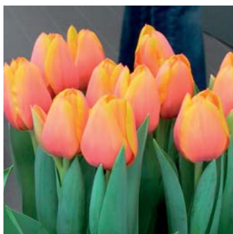
Tulipa 'Diamond Ad Rem'