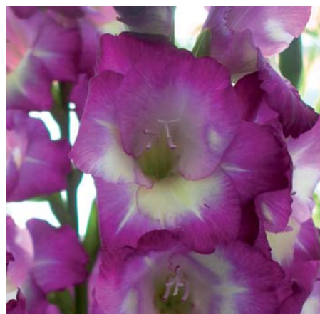
Gladiolus 'Kings Lynn'

Gladiolus 'Kelly' (Kleinbloemige Groep), GLD 365 Edibulbcode: 80469 NAGC code: 341 Registrant: Coöperatieve Kwekersvereniging "Forever" U.A., Waarland. Samenvatting: licht blauwrose 65D met paarsrood N57B. Winner: Coöperatieve Kwekersvereniging "Forever" U.A., Waarland.