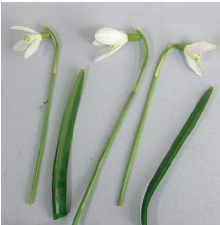
Galanthus nivalis 'Tommy'